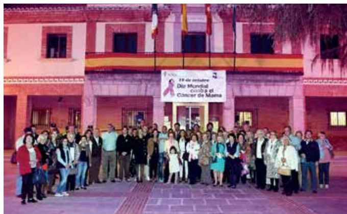
Asistentes al Acto celebrado en la Plaza Mayor.