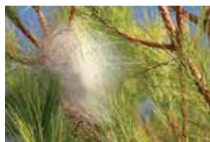
Bolsa de procesionaria del pino.

La campaña municipal va dirigida a los propietarios de fincas o parcelas que se quieran sumar a esta iniciativa, a los que el Ayuntamiento ofrece este servicio que pueden solicitar a través del correo electrónico medio.ambiente@lasroz.es antes del 21 de noviembre. Los interesados deberán abonar 3,40 euros por árbol más 6,81 euros por desplazamiento en la cuenta bancaria destinada al efecto y que está disponible en la web municipal www.lasroz.es . Una vez realizado el ingreso, deberá acreditarse el mismo con el justificante del pago en la Concejalía de Medio Ambiente.