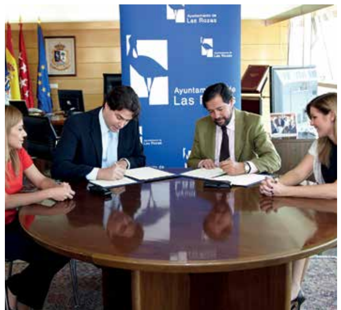
Un momento de la firma del convenio.

En virtud de este acuerdo, la Fundación Alia2 y el Ayuntamiento van a colaborar en el desarrollo de programas y proyectos para minimizar los riesgos de la red en los menores, a través de la sensibilización directa y la atención e información de su entorno familiar. Así, será la Fundación la que -aprovechando su experiencia en actividades formativas y creación de programas informáticos conectados con la Policía que contribuyen a garantizar al menor una navegación segura- desarrolle herramientas tecnológicas y actividades formativas, educativas y de concienciación de las que se beneficiarán los menores de Las Rozas y sus familias.