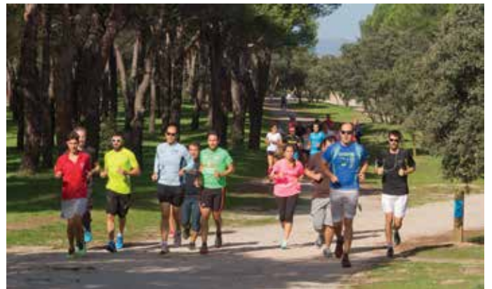
Deportistas en la inauguración del nuevo circuito de running Chema Martínez.

recorrido de 4 kilómetros conocido como el circuito azul, de media dificultad; y por último, el más largo de los recorridos que rodea prácticamente la mayor parte del pinar a lo largo de 6 kilómetros y que se identifica con el color rojo. Todos están perfectamente señalizados con ayuda de placas pilonas, elementos que se suman a los nuevos paneles informativos que orientan al deportista sobre cómo realizar los ejercicios en los diferentes dispositivos ubicados en dos localizaciones de la Dehesa.