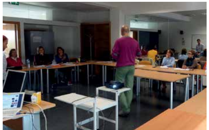
Uno de los talleres dirigidos a emprendedores.

planificación, trámites para el alta legal e inicio de las actividades, análisis crítico de su viabilidad económica o búsqueda de financiación). Ahora, con este nuevo proyecto de consolidación y seguimiento de los nuevos negocios se da un paso más en el servicio que presta el Ayuntamiento de manera gratuita al nuevo empresario.