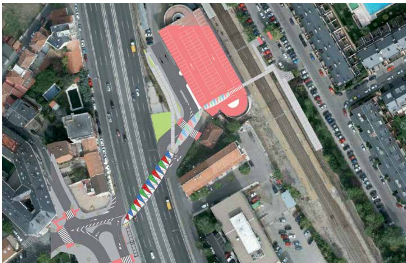
Futura pasarela de acceso sobre A-6 y RENFE.

urbano con otras dos actuaciones. La primera de ellas, también con la vista puesta en los peatones, es una segunda pasarela sobre la carretera de La Coruña (A-6) que enlazará con la anterior y conectará con la Plaza de Madrid y que actualmente está en fase de tramitación del expediente de contratación.