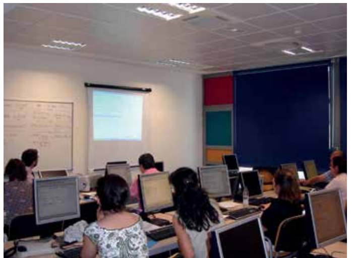
Más de 400 alumnos se han inscrito en estos cursos.

Las materias que se ofrecen son Ofimática (190 horas), Técnicas de administración de pequeñas empresas (220 horas), Publicación de páginas web (160 horas) y Alemán básico (160 horas). Además de ampliar los conocimientos en estos campos, los participantes recibirán de manera obligatoria 30 horas más de módulos transversales para ir adquiriendo herramientas que pueden resultar muy prácticas en la búsqueda de empleo, como sesiones de coaching, elaboración del currículum o preparación de entrevistas de trabajo.