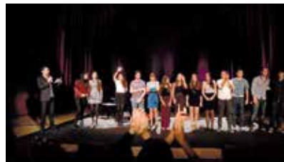
Participantes de Las Rozas Acústica.

La II edición del Festival Las Rozas Acústica, organizado por la Concejalía de Educación y Cultura, finalizó el pasado 25 de octubre con un gran concierto en el Auditorio Joaquín Rodrigo en el que actuaron jóvenes músicos del municipio que se presentaron en busca de una oportunidad para demostrar su talento.