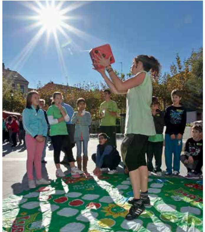
Imagen de la pasada edición de la Gymkhana de los Derechos de la Infancia.

Se han programado otros eventos y actividades como la Gymkhana cultural para participar en familia con diferentes pistas situadas en la C/ Real; los Talleres Solidarios; la Gymkhana de los Derechos de la Infancia, con la participación de alumnos de 5º de primaria; Merienda Solidaria en Familia con actuación teatral dirigida a los más pequeños; Marcha Solidaria en colaboración con Unicef; exposiciones sobre los Derechos, actividades culturales como teatro, danza, cuentacuentos. Destacar además las ponencias dirigidas a padres en los que se abordarán temas como la “Redes sociales y Menores” y “Educar sin gritar. Hacia una educación en positivo”.