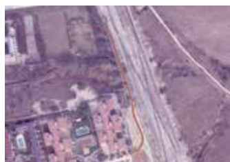
Senda peatonal Valle del Roncal.

sobre el actual acceso desde la carretera -dejando el puente para uso semipeatonal y ensanchando sus aceras- y modificar los sentidos de circulación de la Avenida de La Coruña.