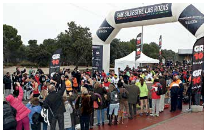
Salida de la pasada edición de la San Silvestre de Las Rozas.

La San Silvestre de Las Rozas es una buena alternativa para aquellos corredores que deseen participar en esta tradicional prueba sin tener que salir del municipio el último día del año. Las inscripciones podrán realizarse hasta el 26 de diciembre en www.sansilvestredelasrozas.es , donde está disponible toda la información relativa a la carrera.