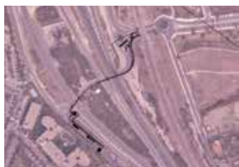
Aceras de La Marazuela.