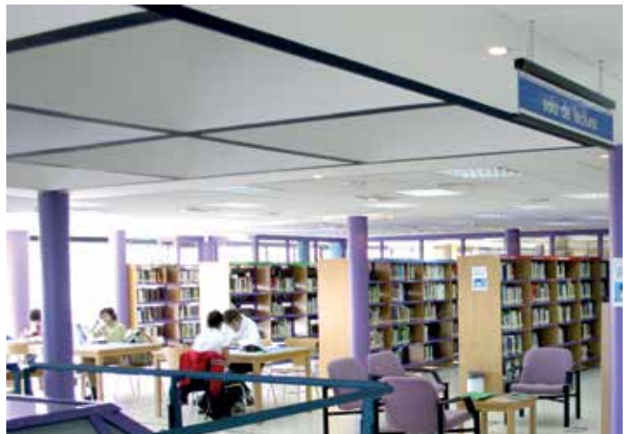
Biblioteca de Las Matas.

Con este servicio, cualquier vecino de Las Rozas que tenga el carné de la biblioteca, una cuenta de correo electrónico y un dispositivo digital (tableta, teléfono inteligente, ordenador personal o lector de e-book) tendrá acceso gratuito a 1.500 títulos en formato digital, incluyendo grandes novedades editoriales, con un límite de descarga de hasta tres títulos durante 21 días. La lectura se podrá realizar tanto en streaming, que permite la visualización de un archivo en tiempo real sin necesidad de descarga, como a través de la aplicación de lectura eBiblio Madrid para tabletas y teléfonos inteligentes disponible para IOS y Android, o bien mediante