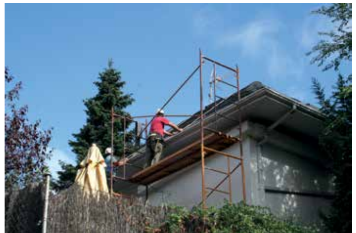
Obras de rehabilitación en una vivienda.

IDAE y otras administraciones públicas. De hecho, la Federación ya está trabajando para analizar posibles actuaciones en comunidades que tengan déficits de rehabilitación o eficiencia energética y quieran promover un expediente para mejorar sus viviendas.