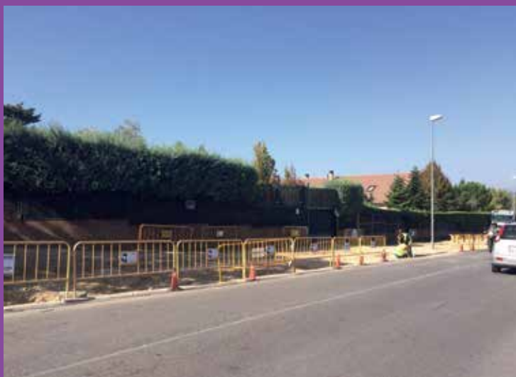
Obras en la calle Micenas.

Paralelamente a los proyectos del Área de Urbanismo, la Concejalía de Servicios Generales está desarrollando una serie de actuaciones de reparación, conservación y mejora de la ciudad que sólo este año han supuesto una inversión de dos millones de euros. Así, próximamente se pondrá en marcha la renovación del alumbrado exterior en las urbanizaciones El Pinar y El Golf con la instalación de un nuevo sistema de iluminación dotado con luminarias LED, que supondrá una mejora de las condiciones de visibilidad y una reducción tanto del consumo de energía como de la contaminación lumínica. También se va a incrementar el nivel de iluminación de la calle Micenas, el eje principal de conexión entre la zona del Parque Empresarial y las urbanizaciones Monterrozas y El Cantizal, que está experimentando una completa remodelación con aceras más amplias y ajardinadas para mejorar el tránsito peatonal entre la calle Tracia y la calle Santos.