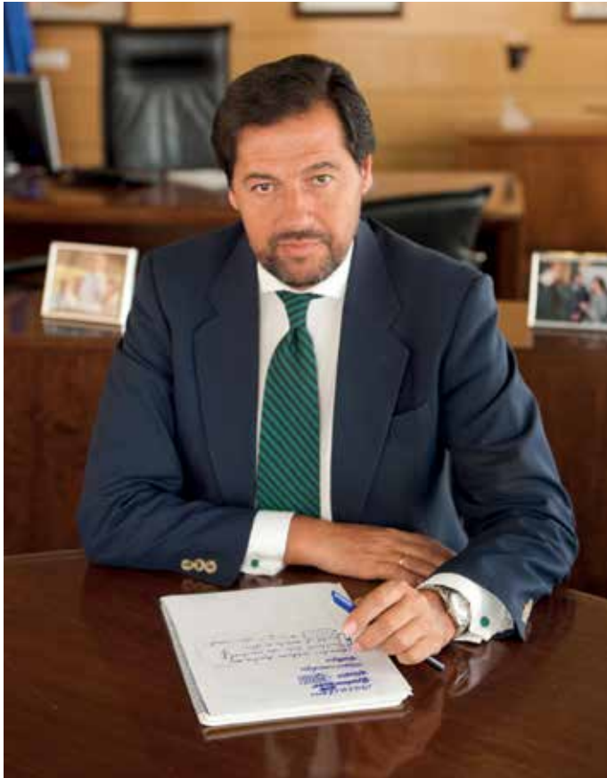
José Ignacio Fernández Rubio Alcalde-Presidente

En este último número del año del Boletín Informativo Municipal dedicamos la portada a las actuaciones que va a llevar a cabo el Ayuntamiento con el fin de mejorar la movilidad y accesibilidad en nuestro municipio. Mencionar especialmente los trabajos que están realizando en La Marzuela y que facilitarán, tanto a peatones como a vehículos, los accesos y desplazamientos en el barrio y hacia el centro urbano del municipio.