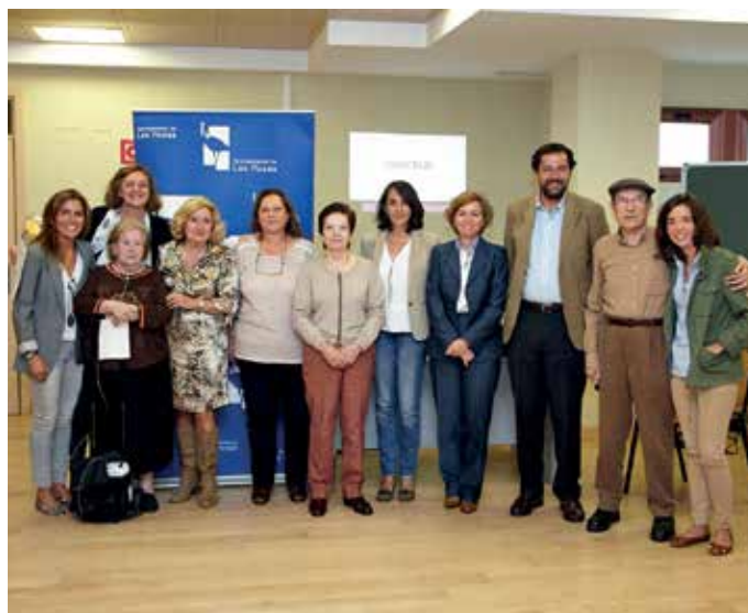
La directora general de Voluntariado visitó el Centro de Mayores El Baile.

El perfil del voluntario en Las Rozas es el de una mujer, de edad media, activa y con estudios superiores. En la actualidad tienen su sede en el municipio 20 entidades con fines sociales en las que colaboran voluntarios. Entre los programas en los que actúan y colaboran los voluntarios destacan el apoyo socioeducativo a la infancia, acompañamiento de mayores, actividades con personas con discapacidad, apoyo en la gestión de entidades y ONG's del municipio o cursos y talleres en el programa de mayores.