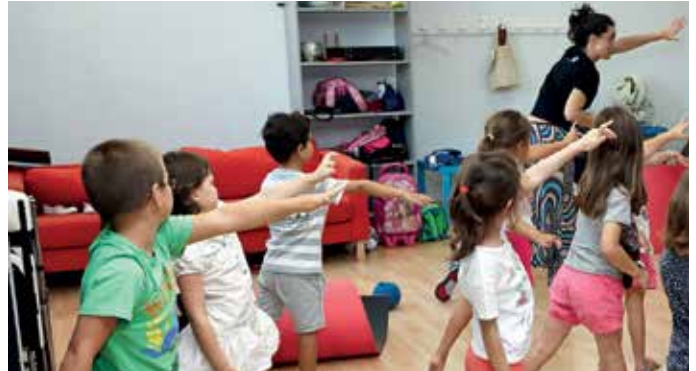
Actividad en la Escuela de Teatro.

Así, incluye distintos niveles y cursos de teatro para niños -a partir de 4 años-, jóvenes, adultos y personas mayores, donde se trabajan aspectos como la creación de personajes, interpretación, expresión verbal y corporal, y puesta en escena de un montaje teatral. El proceso culmina con una representación ante el público en las muestras de teatro que se organizan en febrero y al final de curso.