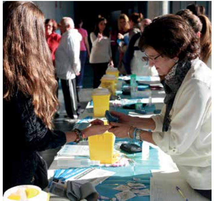
Medición de glucemia.

La Organización Mundial de la Salud (OMS), junto con la Federación Internacional de la Diabetes (FID), instauraron en 1991 el 14 de noviembre como el "Día Mundial de la Diabetes" en conmemoración del nacimiento de Frederick Banting, que junto con Charles Best, concibieron la primera idea que condujo al descubrimiento de la insulina en 1922.