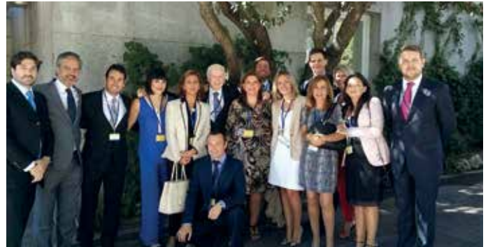
Miembros de la Fundación Alia2 con sus embajadores, Irene Villa y Christian Gálvez.

La Fundación Alia2 refuerza estas acciones con campañas globales de comunicación en prensa, radio y TV con contenidos adaptados al público al que van dirigidas en cada caso.