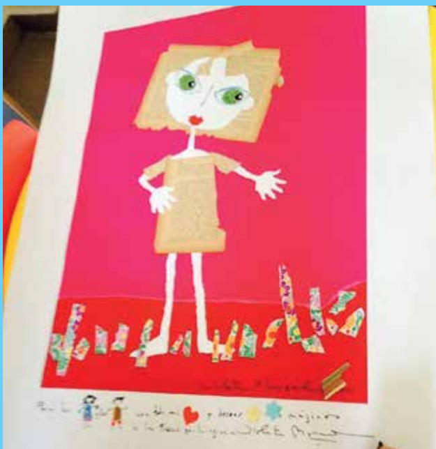
Algunas de las obras llevan la dedicatoria de los autores a la Infancia de Las Rozas.

La exposición podrá visitarse hasta el 30 de noviembre en la Concejalía de Familia y Menor, sita en la C/ Comunidad de la Rioja, 2.