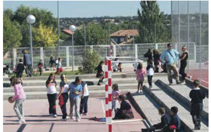
Las actividades extraescolares de carácter deportivo se beneficiarán de la ayuda.

Con este convenio, que mantiene la apuesta del Consistorio por la educación y la ayuda a las familias, las AMPAS podrán elegir las extraescolares que se ofrecerán, a condición de que el correspondiente Consejo Escolar lo apruebe. Las cantidades a percibir se determinan en función del número de niños apuntados en las actividades y del porcentaje de alumnado de origen inmigrante matriculado en el centro.